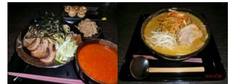
辛味噌つけ麺と餃子 辛味噌ラーメン

好評につき、今年度も引き続きお送りします♪ 今回は、皆さんもご存知かと思いますが、“もちもちの木”の、つけ麺を取材してきました(^^)♪ もちもちの木蓮田店は味噌味のつけ麺がお勧めで、今回は辛味噌つけ麺と辛味噌ラーメン、新発売の餃子も食べてきました(^u^)もちもちの木の味噌ラーメンのスープは濃厚な味噌とにんにくが効いていて、スタミナ満点のラーメンです☆餃子は、外はパリッと中はもちもちで丸くてかわいい餃子です。是非一度、御賞味あれ(*^^)v