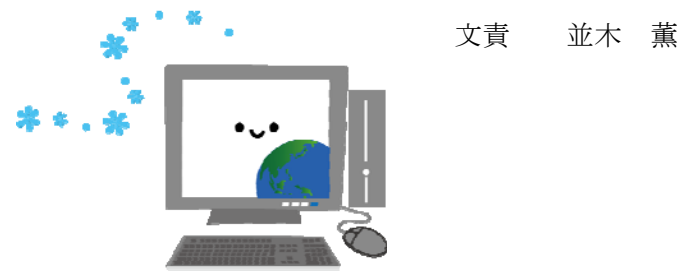
文責 並木 薫

入院の臨床検査が必要に応じて行われているとは思いますが、そのためにどれだけのコストを費やしているのかも頭の片隅において考えていただければ、経営的に大変救われるのではないのでしょうか。